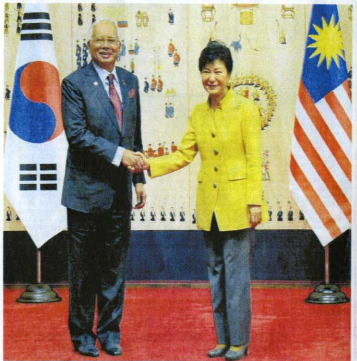
NAJIB TUN RAZAK bersalam dengan Park Geun-hye semasa menghadiri mesyuarat delegasi dua hala di Blue House, Seoul, Korea Selatan, semalam. - BERNAMA

Sempena sambutan ulang tahun ke-55 hubungan Malaysia-Korea Selatan tahun depan, Perdana Menteri turut menyampaikan jemputan kepada Park melakukan lawatan rasmi ke Malaysia. - UTUSAN